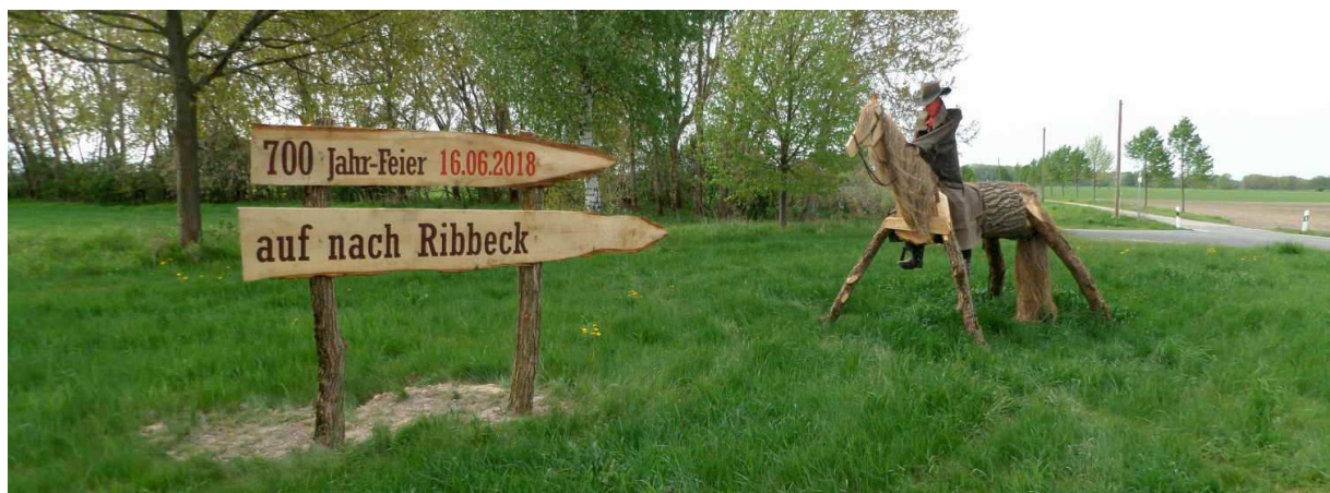
Hennigsdorf im Juni 2018

Am 16. Juni 2018 feierte Ribbeck die Ersterwähnung vor 700 Jahren.